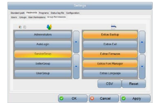
Benutzer- und Rechteverwaltung